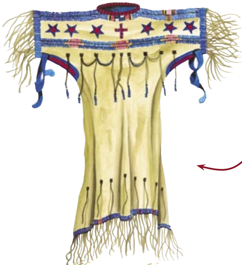
ROCHIE de damă din piele de antilopă tăbăcită