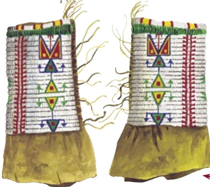
JAMBIERE purtate de războinicii lakota (piele și perle brodate)